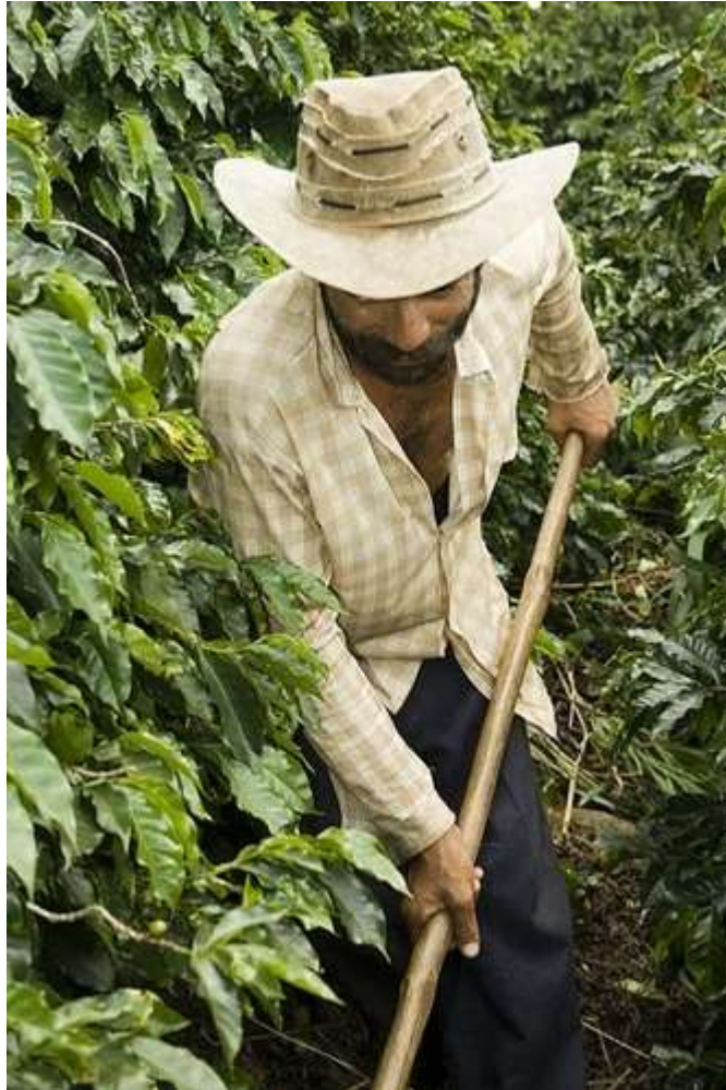
(Un fermier cultivând cafea în mediul rural, Brazilia)

dăunători, și gestionarea mediului de cultură departe de condițiile favorizante pentru dăunători.