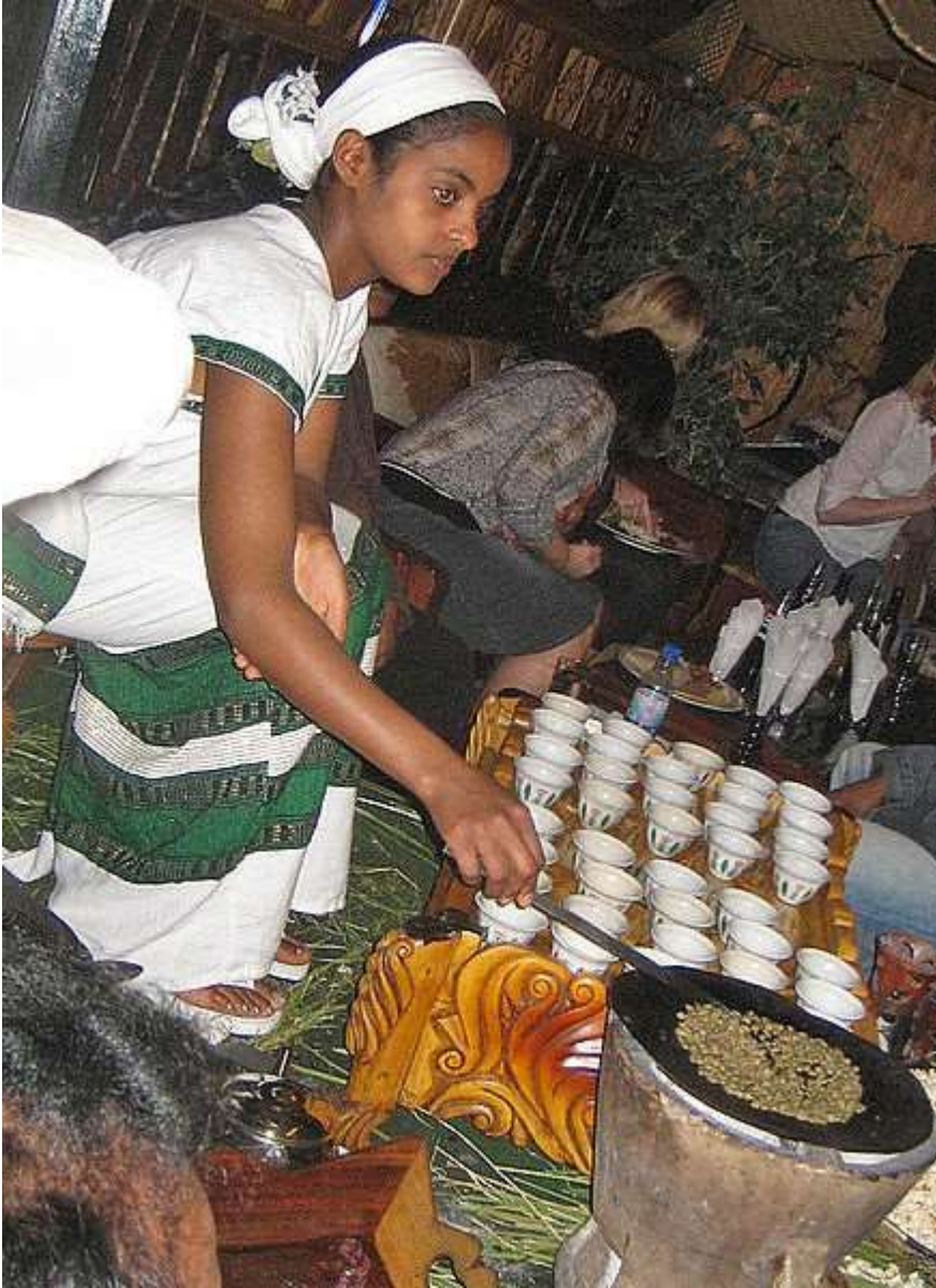
(O femeie etiopiană prepară cafea la o ceremonie tradițională. Prăjește, zdrobește și prepară cafeaua la fața locului, https://en.wikipedia.org/wiki/File:Ethcofcerm.jpg )

Boabele de cafea pot fi măcinate în mai multe moduri. O râșniță de cafea Burr utilizează elemente rotative pentru măcinarea boabelor, un polizor taie boabele cu lamele în mișcare la viteză mare, iar un mojar zdrobește boabele. Pentru cele mai multe metode de preparare, râșnița de cafea Burr este considerată superioară, deoarece măcinarea este superioară, și poate fi ajustată.