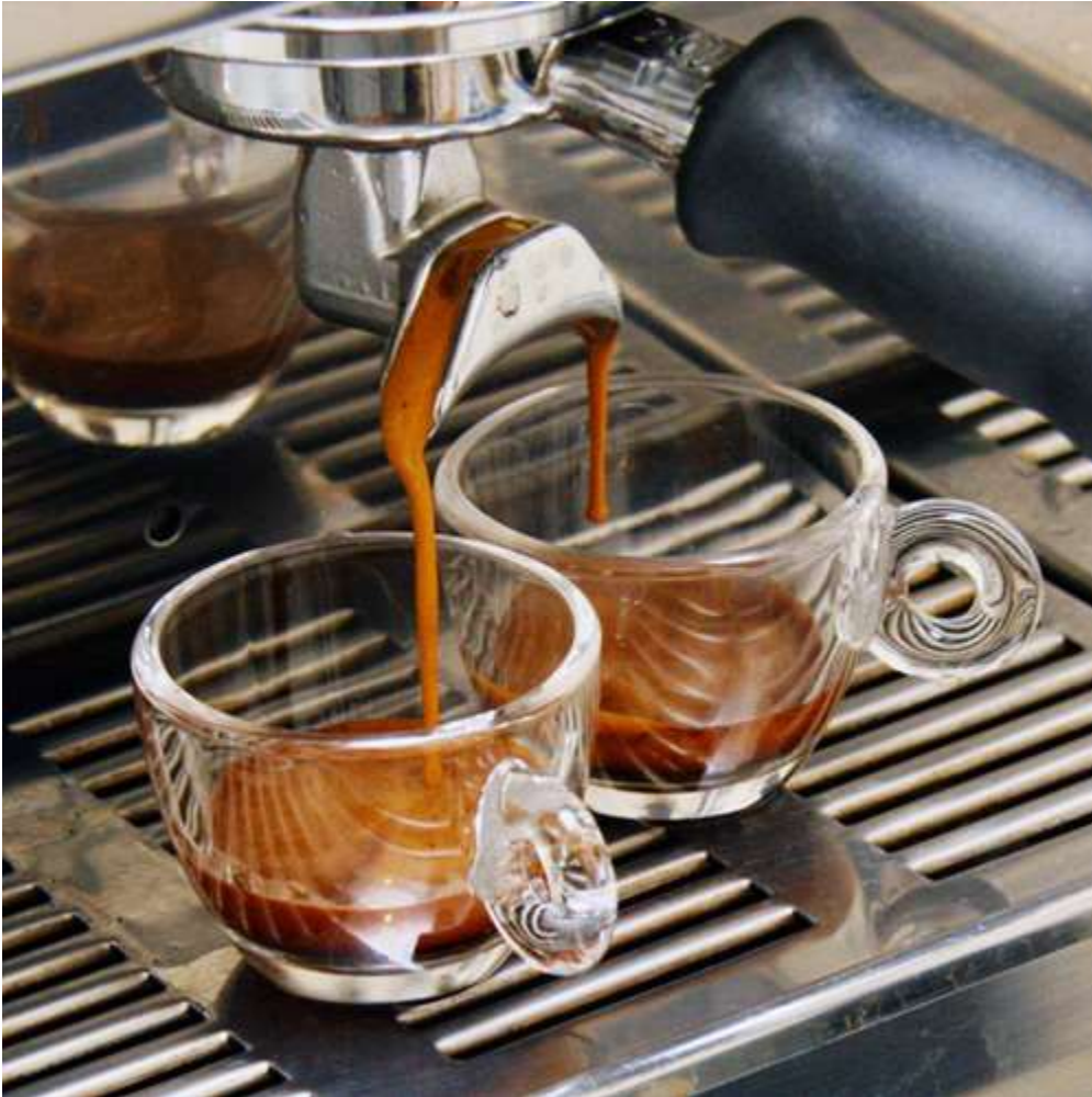
(Prepararea espresso, cu mult-dorita cremă închisă la culoare)

Există mai multe variante de preparare, în funcție de finețea de măcinare, modalitățile în care apa extrage aroma, arome suplimentare (zahăr, lapte, condimente), și tehnici de separare a zațului. Temperatura ideală de preparare este între 79-85°C, iar temperatura ideală de servire este între 68-79°C.